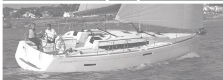
Sun Odyssey 419