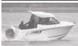
Merry Fisher 605