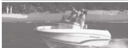
Cap Camarat 5.1 CC