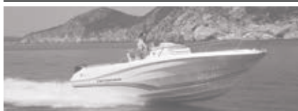
Cap Camarat 7.5 CC