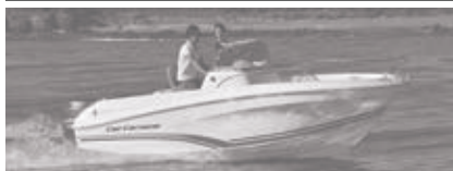
Cap Camarat 5.5 CC