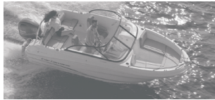
Cap Camarat 5.5 BR