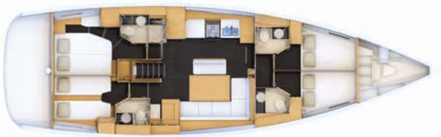
Version 4 cabines : Deux cabines modulable à l'avant, cabine VIP et cabine invités à l'arrière (banquette de carré optionnelle)