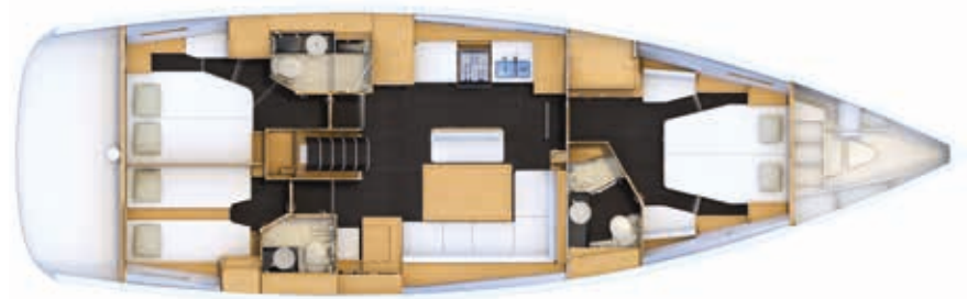
Version 3 cabines : Cabine avant propriétaire, cabine VIP, cabine invités (banquette de carré optionnelle)