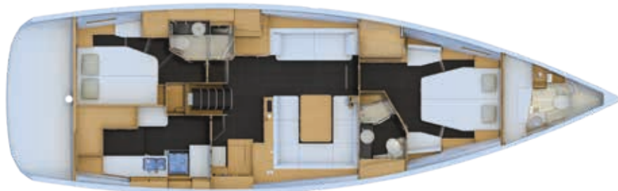
Version 2 cabines : Cabine avant propriétaire, cabine VIP, grand carré et cuisine arrière (illustration avec cabine skipper optionnelle)