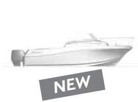
Merry Fisher 585 cabin