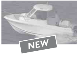
Merry Fisher 585 marlin