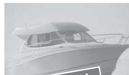
Merry Fisher 815