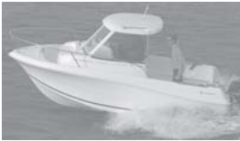
Merry Fisher 585 marlin