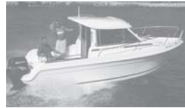
Merry Fisher 625