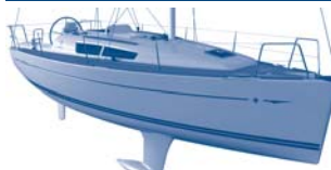
Sun Odyssey 33i