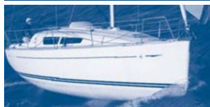
Sun Odyssey 30i