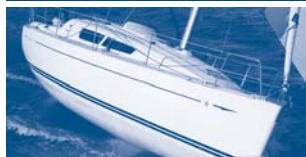
Sun Odyssey 30i Performance