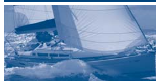
Sun Odyssey 42i