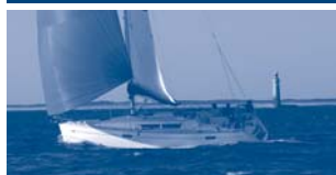
Sun Odyssey 39i Performance