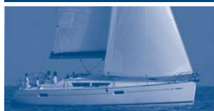
Sun Odyssey 39i