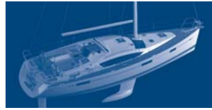
Sun Odyssey 42 DS