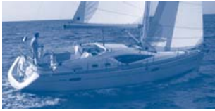
Sun Odyssey 39 DS