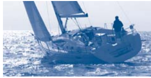
Sun Odyssey 39 DS Performance