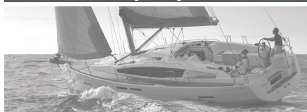
Sun Odyssey 41 DS