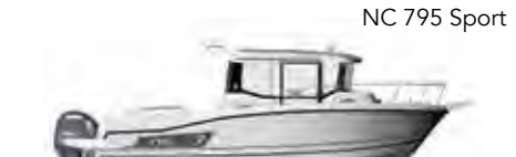
NC 795 Sport

ES Con su moderno diseño con fuerte personalidad, la NC 795 Sport ofrece una verdadera comodidad de navegación y de vida a bordo. Su probada carena, estable y rápida, aumenta su rendimiento. Con su estilo aventurero, esta «SUV de los mares» revela una gran amplitud de uso. Según su configuración (1-2-3 puertas), la NC 795 Sport favorece el programa de pesca o la excursión en familia. En modo «pesca», la gran bahía de popa con 3 paneles, las anchas puertas laterales, las cubiertas empotradas, aseguran y facilitan la circulación entre la cabina del piloto y la carlinga. El espacio ofrecido, máximo, puede recibir en función de las opciones elegidas todos los equipos dedicados a la pesca, así como a una cabina de pilotaje exterior (opcional). El 3º asiento de refuerzo (opcional) permite incluso pescas con amigos. En modo «excursión familiar», la NC 795 Sport asocia comodidad y espacios de convivencia con un banco adosado, detrás de la cabina de mando al abrigo del viento. Esto se encuentra frente a la cómoda carlinga cuadrada aún más grande, transformable en zona para tomar el sol.