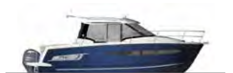
NC 895 Legend

ES Diseñada como crucero, la NC 895 es una verdadera week-ender. Ofrece una luminosidad incomparable, gracias a los grandes ventanales de la cabina de pilotaje, con más comodidad a bordo para compartir momentos agradables. La carlinga disfruta de un salón en L, con asientos alargados y apoyabrazos que pueden acomodar portavasos. Tanto en el interior como en el exterior, el sistema de asientos puede girar para adaptar el asiento a sus deseos.