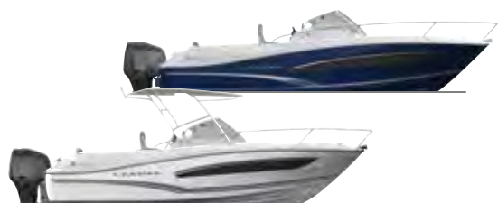
Leader 7.5 p. 38 – 39