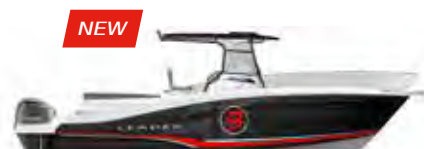
Leader 9.0 CC p. 42 – 45

ES Mini cruceros, esquí náutico, buceo, pesca En Leader, gracias a una carena estable y potente, la seguridad de los pasajeros está asegurada en toda la eslora. El acondicionamiento de la cabina central permite disfrutar de confortables mini cruceros improvisados.