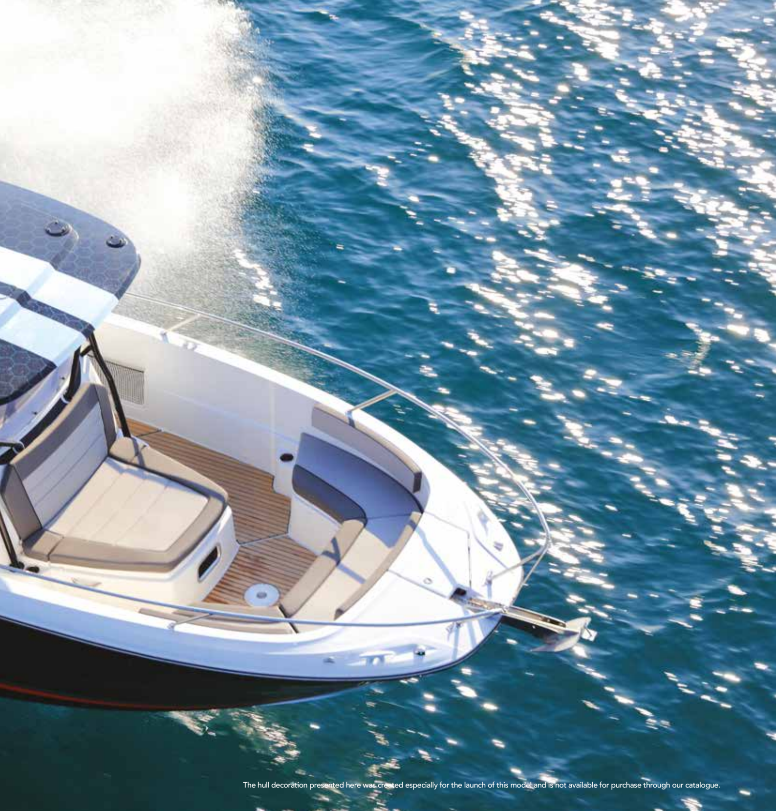
The hull decoration presented here was created especially for the launch of this model and is not available for purchase through our catalogue.

ES La Leader 9.0 Center Console ofrece un programa de navegación múltiple para emocionantes viajes al mar en familia o con amigos. ¡Esta nueva Center Console es perfecta para combinar pesca y momentos de convivencia! La consola central muy protectora, el tablero envolvente y las 3 plazas frente al mar garantizan una gran comodidad en la navegación. En popa, el banco central profundo, un auténtico sofá y los 2 asientos plegables completan la sensación de espacio y comodidad de la gran carlinga. Esta gran carlinga de popa puede acomodar una mesa para crear un espacio de zona de estar muy agradable, pero también puede convertirse en una gran zona de sol. Pensado para la relajación y el bienestar, este modelo tiene una magnífica cabina en la parte de proa que consiste en un verdadero meridiano y una zona de estar delantera, todo transformable en una gran zona de sol. Redes de almacenamiento, portacañas, peceras y diversos lugares de almacenamiento facilitan las actividades de pesca. Por primera vez en una Center Console de este tamaño, se dispone de cama doble central y de un compartimento independiente para baños / ducha.