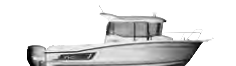
NC 695 Sport

ES A bordo del NC 695 Sport, volvemos a encontrar los ingredientes esenciales de la gama: un look aventurero, una puerta lateral que da acceso al pasillo lateral rebajado y una inmensa bañera de popa. ¡Tantos elementos que apreciarán los pescadores! La carena tradicional en V evolutiva, asociada a la motorización fueraborda, es rápida y estable a cualquier velocidad de marcha todo esto con la practicabilidad de motores fuera borda.