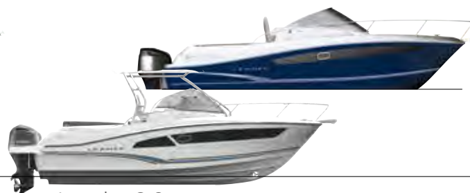
Leader 9.0 p. 34 – 37

EN Weekend cruising, water skiing, diving, fishing... In a Leader, with its stable, powerful hull, passenger safety is assured from tip to stern of the boat. The centerline cabin is designed for your comfort on those improvised weekend cruises.