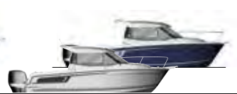
NC 695 & 695 Legend p. 20 - 21

EN In Europe, the NC has become a reference for its design concept, style, performance and comfort onboard. In all sea conditions, the NC is seaworthy and sure, distinguished by its extraordinary versatility, capable of transforming from 100% cruiser to 100% fishing boat.