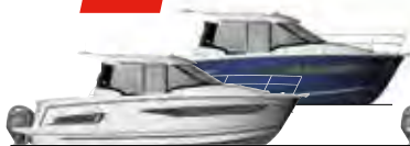
NC 1095 & 1095 Legend p. 8 - 11