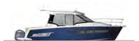
NC 795 Legend

ES Descubre la NC 795 con su dinámico y sinuoso diseño! Su tradicional casco en V y su reconocida estabilidad, ofrecen un rendimiento extraordinario en el agua. Perfectamente adaptada al crucero costero, la NC 795 ofrece aún más innovaciones y total bienestar a bordo. Es ideal para pasar unos agradables momentos con la familia o amigos, este modelo invita a usar la bañera y el salón en U, que se puede transformar en solárium. ¡Abierta al exterior con sus plataformas de baño a nivel de bañera, la NC es una verdadera invitación al baño!