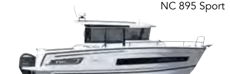
NC 895 Sport

ES Jeanneau prepara la nueva NC 895 Sport que se dará a conocer en primicia en el Salón Náutico de París (diciembre 2018). Dotada con el notable casco de la última NC 895, una cubierta súper tendencia y una cálida disposición interior, ¡este nuevo modelo promete un enfoque muy innovador de la famosa gama de la marca Jeanneau! ¡La NC 895 Sport será sobretodo una embarcación con una muy fuerte personalidad!