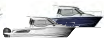
NC 795 & 795 Legend p. 16 - 19