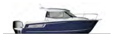
NC 695 Legend

ES La dinámica NC 695 es un crucero multi uso, ideal para salidas familiares. El perfil del parabrisas y las grandes puertas de cristal correderas la hacen elegante como elementos imprescindibles en las embarcaciones de bonito diseño. La NC 695 es un sueño hecho realidad y equipa una bañera que invita a compartir (incluso amarrados en puerto con el motor levantado). En cuanto a la cabina, con un diseño inteligente para un modelo de este tamaño, puede acomodar a 4 personas.