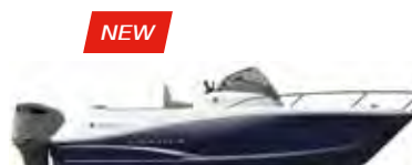
Leader 6.5 p. 40 – 41