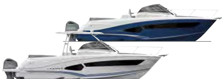
Leader 10.5 p. 30 – 33