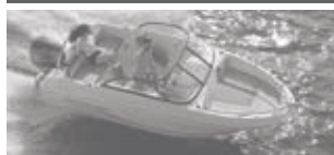
Cap Camarat 5.5 BR