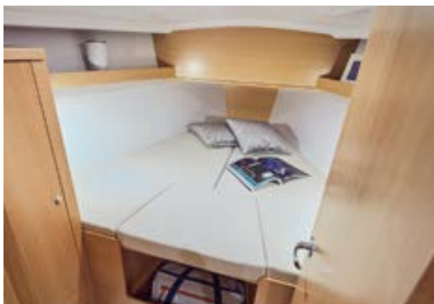
◄ Comfort optimized cabins with storages and hanging locker Confort des cabines optimisé, proposant du rangement et une penderie Komfort optimierte Kabinen mit Stauraum und Kleiderschrank Cabinas confort optimizado con almacenes y armarios Cabine confort ottimizzato con depositi et appendiabiti