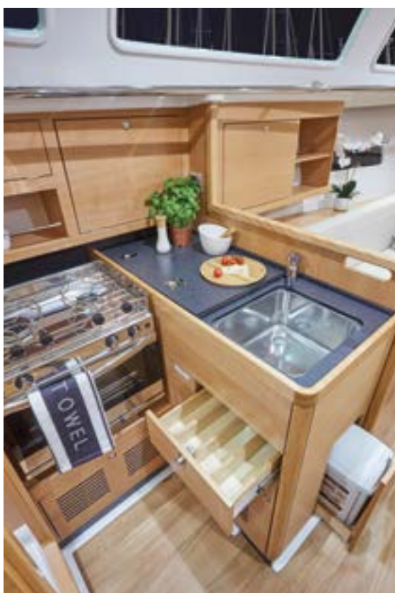
▲ Well-equipped kitchen for cruising Cuisine bien équipée pour la croisière Gut ausgestattete Küche für die Kreuzfahrt Cocina bien equipada para navegar Cucina ben attrezzata per la crociera