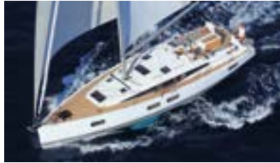
Jeanneau Yachts Luxury and ocean sailing Luxe et grande croisière