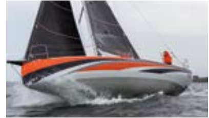
Sun Fast Race short-handed or with crew Course en solitaire comme en équipage