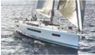
Sun Odyssey Elegance and performance Élégance et performance

Sun Odyssey, Jeanneau Yachts, Sun Fast... with so many models to choose from, there is sure to be a Jeanneau with your name on it! Discover all these and more at www.jeanneau.com , or at your local Jeanneau Dealership.