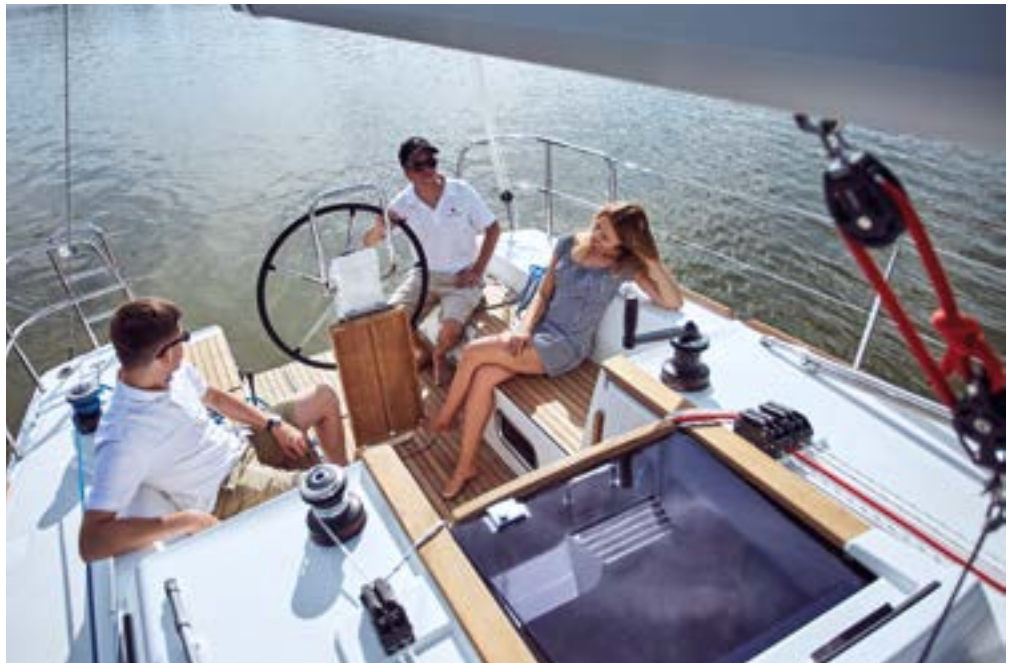
▲ Large cockpit with large seats Un grand cockpit avec de larges assises Großer Cockpit mit großen Sitzen Cockpit grande con asientos grandes Un grande cockpit con sedili larghi