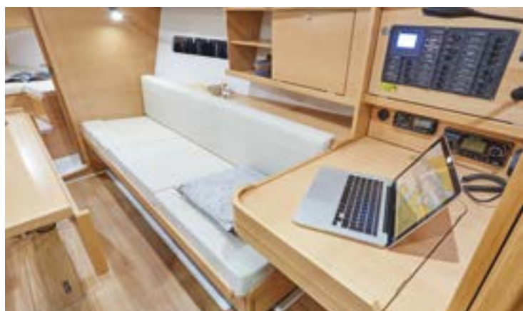
► Functional Chart table Table à carte fonctionnelle Funktionskartentisch Mesa de cartas funcional Tavolo da carteggio funzionale