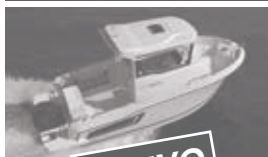
Merry Fisher 605 marlin