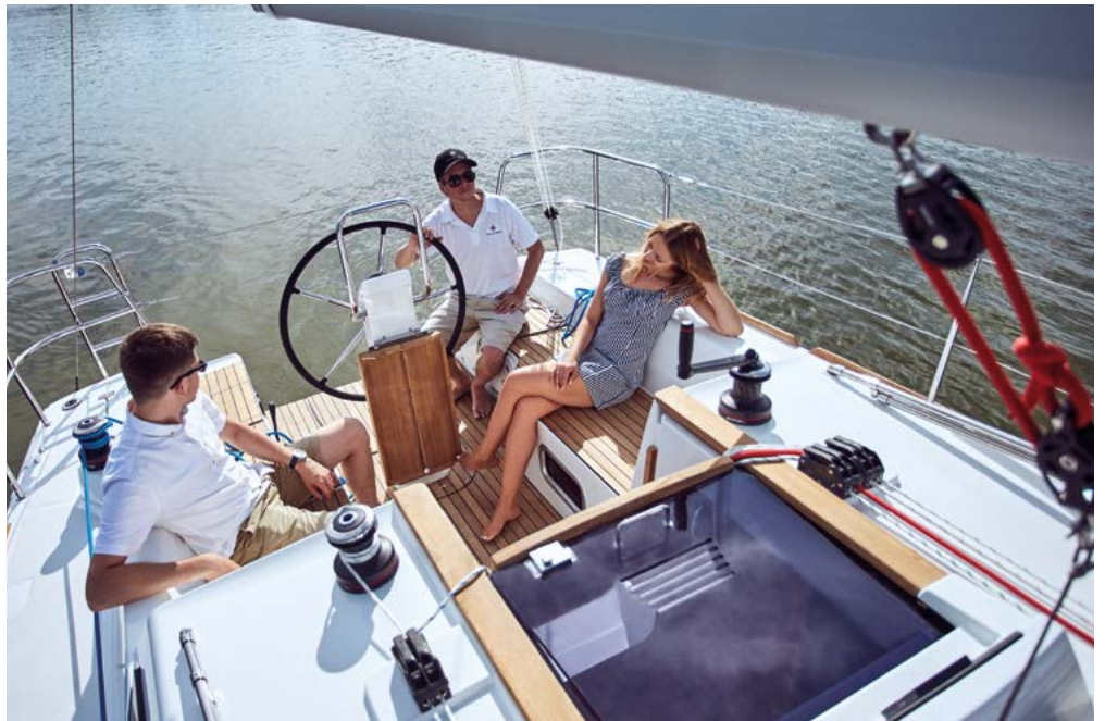
▲ Large cockpit with large seats Un grand cockpit avec de larges assises Großer Cockpit mit großen Sitzen Cockpit grande con asientos grandes Un grande cockpit con sedili larghi