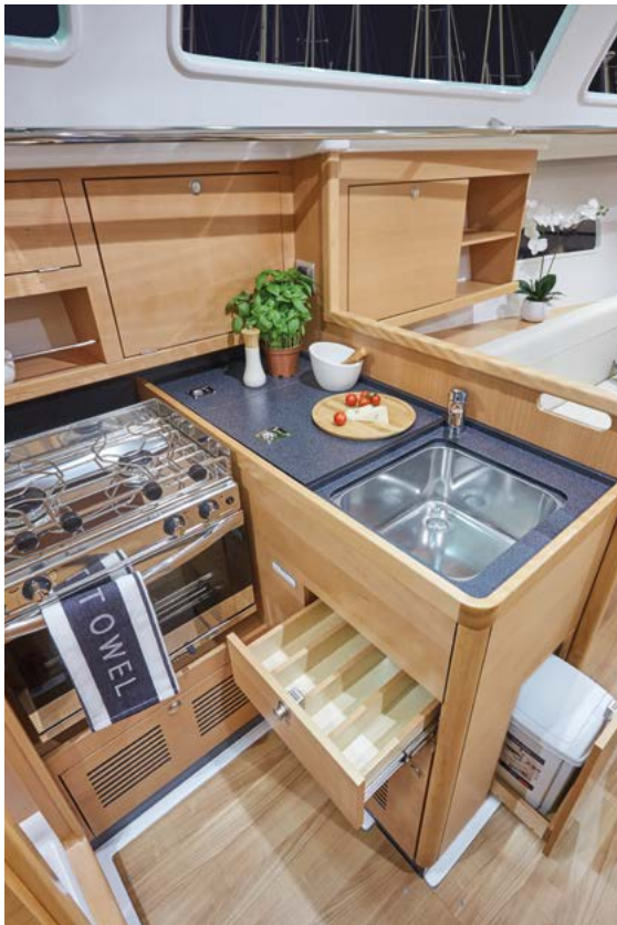
▲ Well-equipped kitchen for cruising Cuisine bien équipée pour la croisière Gut ausgestattete Küche für die Kreuzfahrt Cocina bien equipada para navegar Cucina ben attrezzata per la crociera