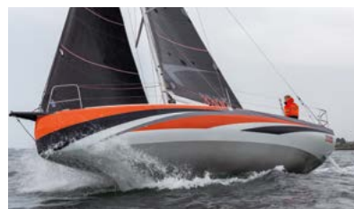
Sun Fast Race short-handed or with crew Course en solitaire comme en équipage