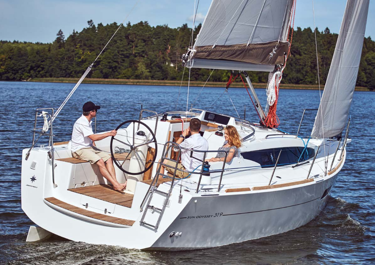
▲ Modern design Design moderne Modernes Design Diseño moderno Design moderno