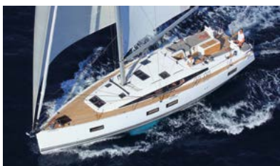
Jeanneau Yachts Luxury and ocean sailing Luxe et grande croisière