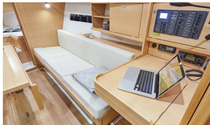
► Functional Chart table Table à carte fonctionnelle Funktionskartentisch Mesa de cartas funcional Tavolo da carteggio funzionale