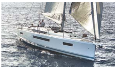
Sun Odyssey Elegance and performance Élégance et performance

Discover all these and more at www.jeanneau.com , or at your local Jeanneau Dealership.