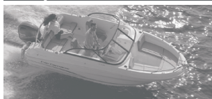
Cap Camarat 5.5 BR