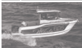
Merry Fisher 695 marlin