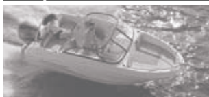
Cap Camarat 5.5 BR