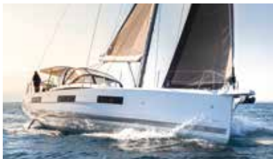
Jeanneau Yachts Luxury and ocean sailing Luxe et grande croisière