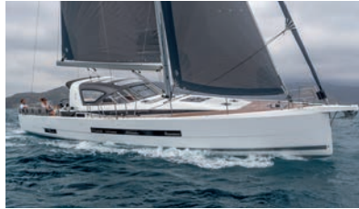
Jeanneau Yachts Luxury and ocean sailing Luxe et grande croisière