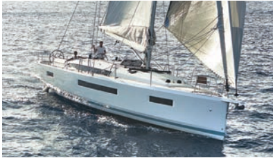
Sun Odyssey Elegance and performance Élégance et performance

Discover all these and more at www.jeanneau.com , or at your local Jeanneau Dealership.