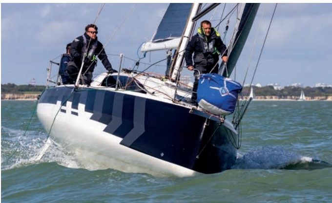
Sun Fast Cup 2023