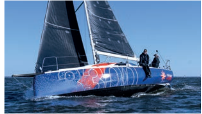
Sun Fast Race short-handed or with crew Course en solitaire comme en équipage