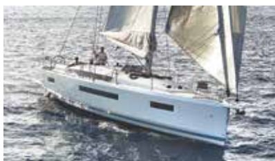
Sun Odyssey Elegance and performance Élégance et performance

Discover all these and more at www.jeanneau.com , or at your local Jeanneau Dealership.