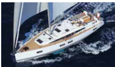
Jeanneau Yachts Luxury and ocean sailing Luxe et grande croisière