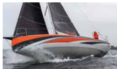
Sun Fast Race short-handed or with crew Course en solitaire comme en équipage