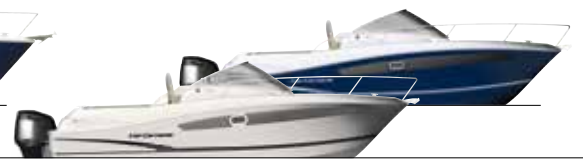
8.5 WA p.12 / 15

EN Weekend cruising, water skiing, diving, fishing... In a Cap Camarat WA, with its stable, powerful hull, passenger safety is assured from tip to stern of the boat. The centreline cabin is designed for your comfort on those improvised weekend cruises.