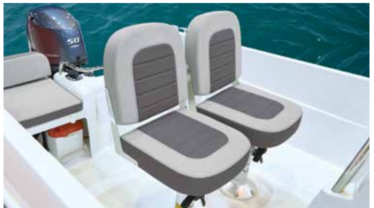
Example of 2017 upholstery - Exemple de sellerie 2017 (photos non contractuelles /not contractual)