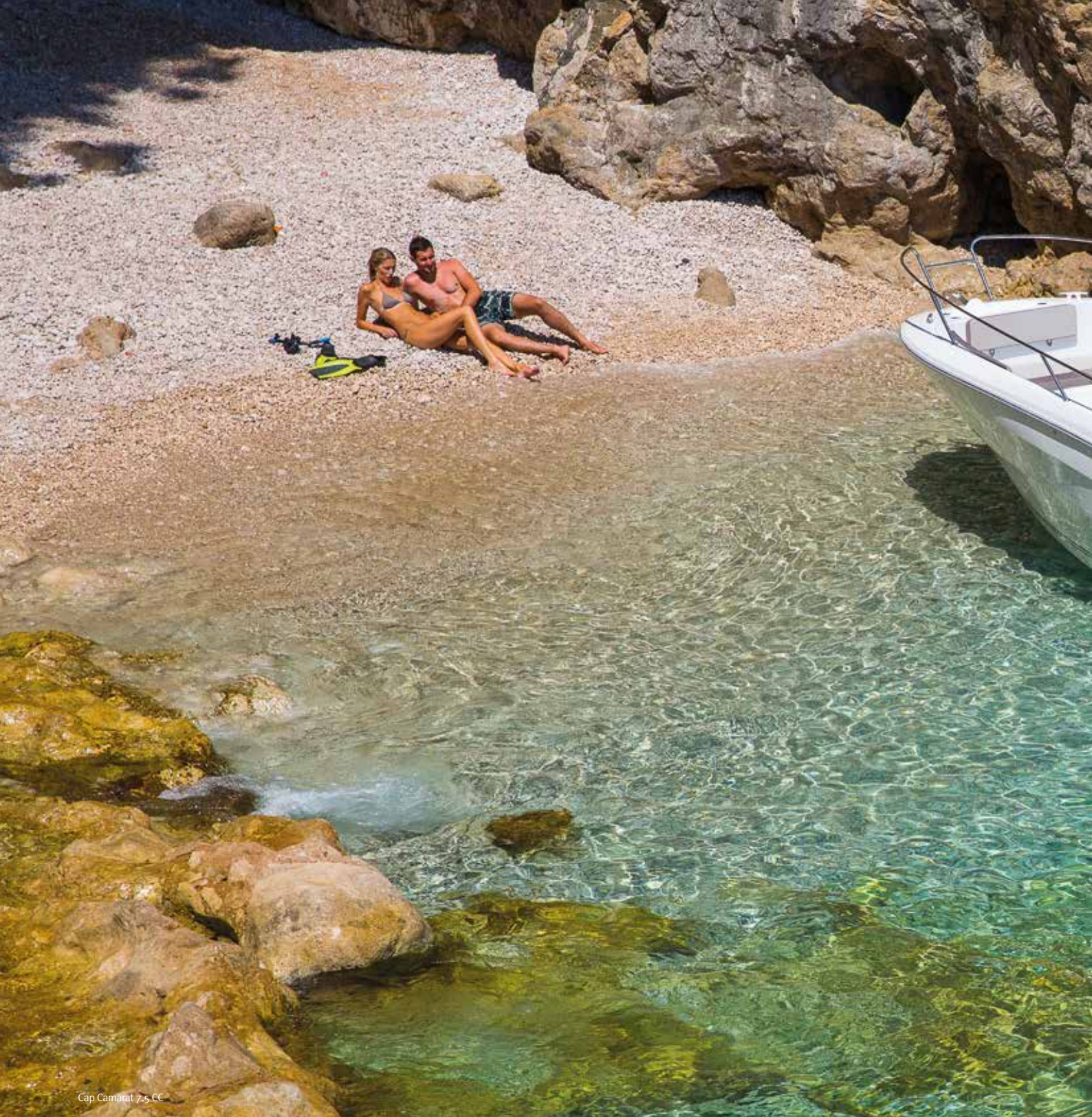
Cap Camarat 7.5 CC