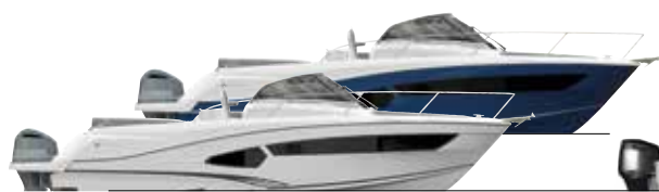
10.5 WA p. 8 / 11