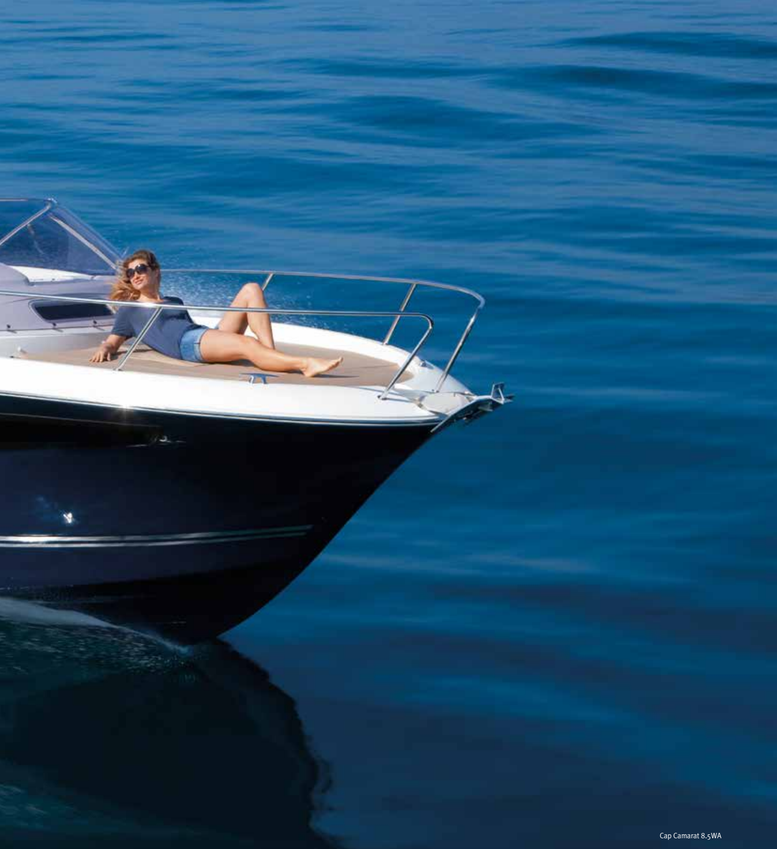
Cap Camarat 8.5WA

ES Precursor de los Walk Around en Europa, Jeanneau marca su dominio con el Cap Camarat 8.5WA. De un diseño fluido y vigoroso, es una embarcación elegante, perfectamente adaptada a un programa de crucero costero y de pesca. Barco marino, mono o bi-motorizado, justifica su ambición con una bañera despejada, una circulación fácil, un gran solárium y un acondicionamiento confortable para 4 personas. ¡Es un barco del que estamos orgullosos!