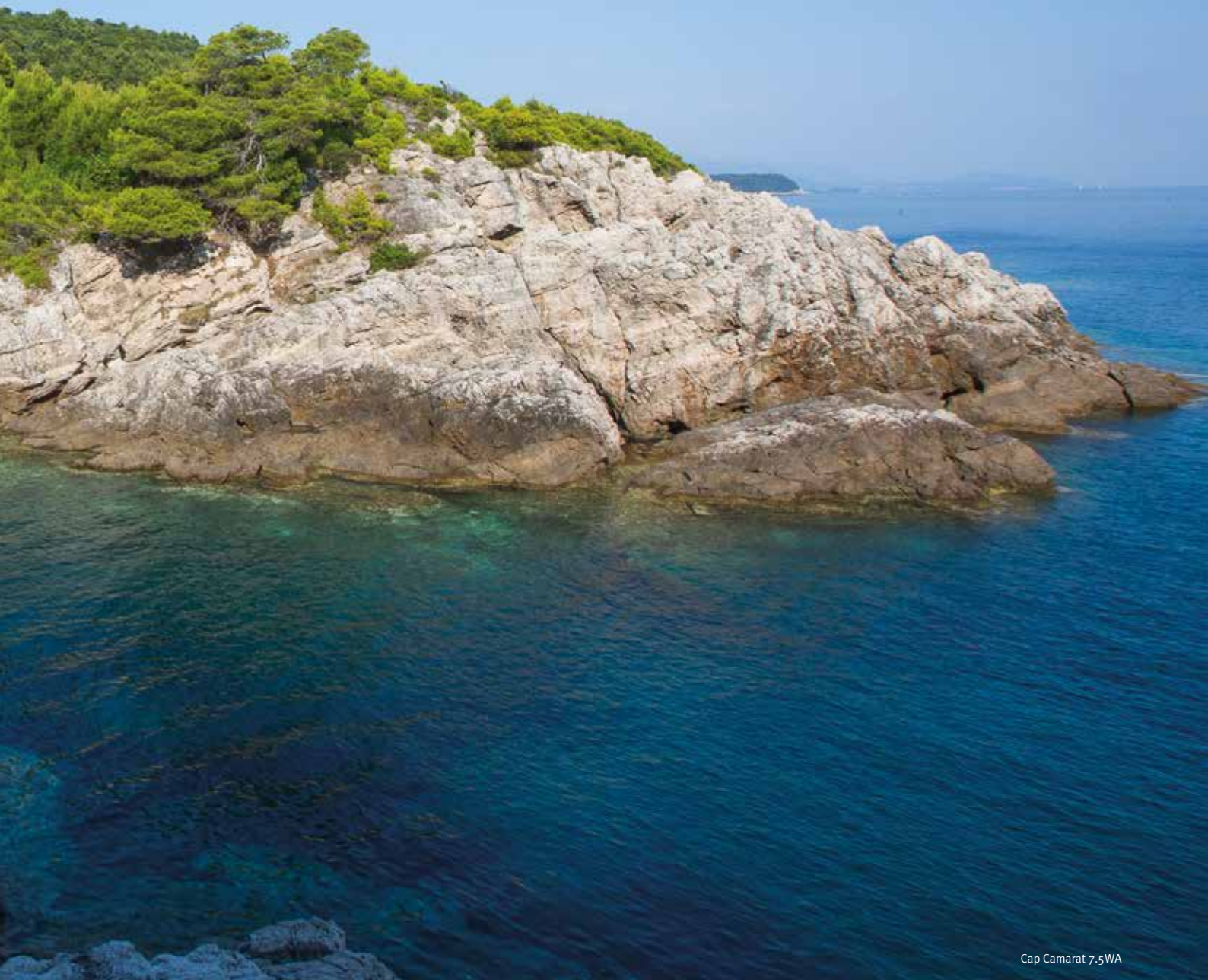
Cap Camarat 7.5WA