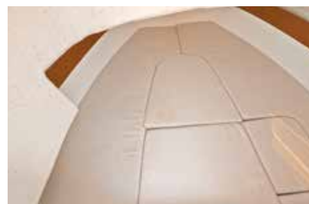
5.5 Walk Around