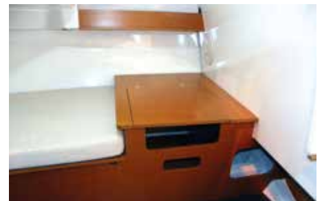
6.5 Walk Around