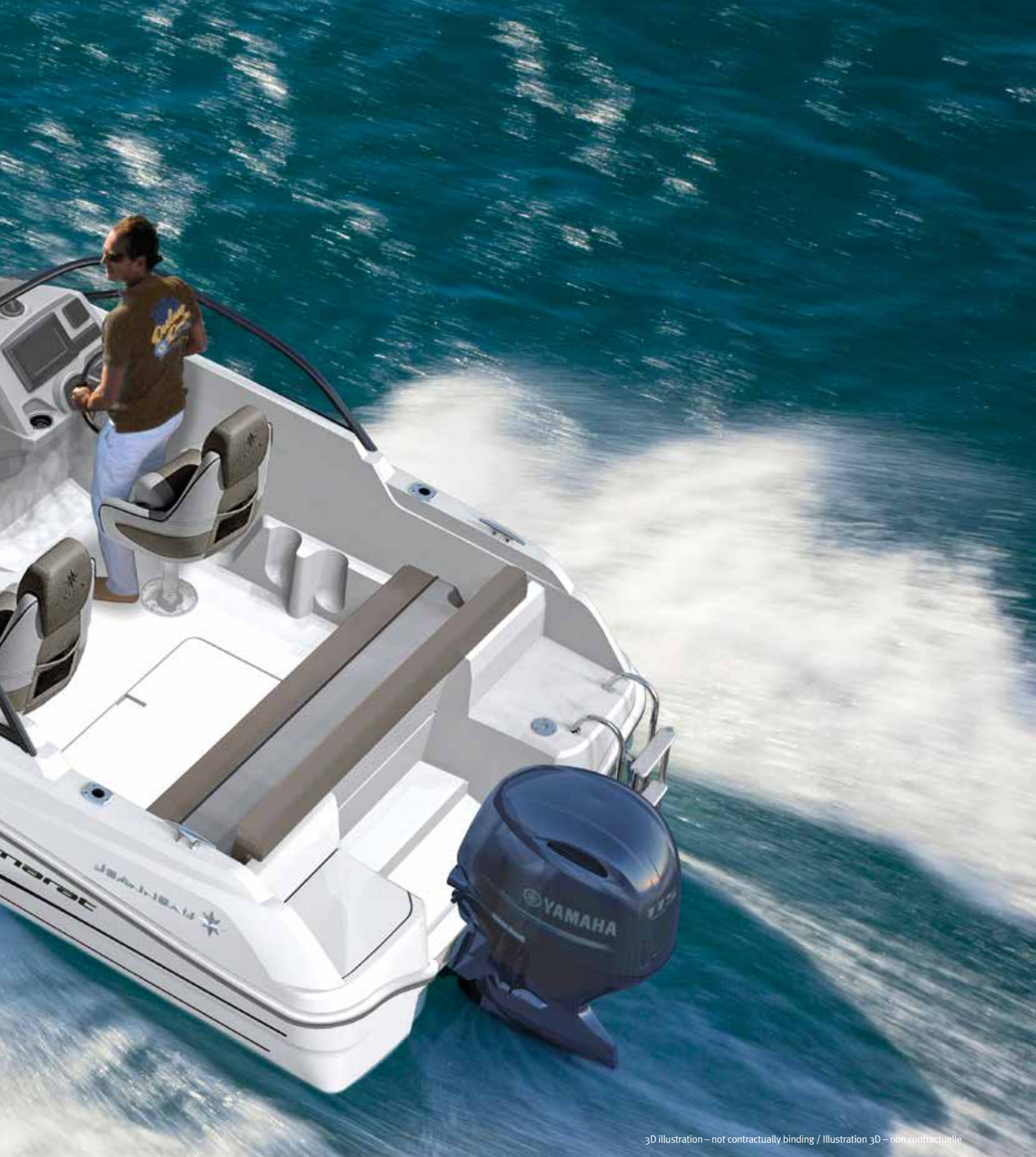
3D illustration – not contractually binding / Illustration 3D – non contractuelle

EN The new line of BOW RIDERS will soon be expanded with the launch of the Cap Camarat 5.5 BR at the 2016 Paris Boat Show.