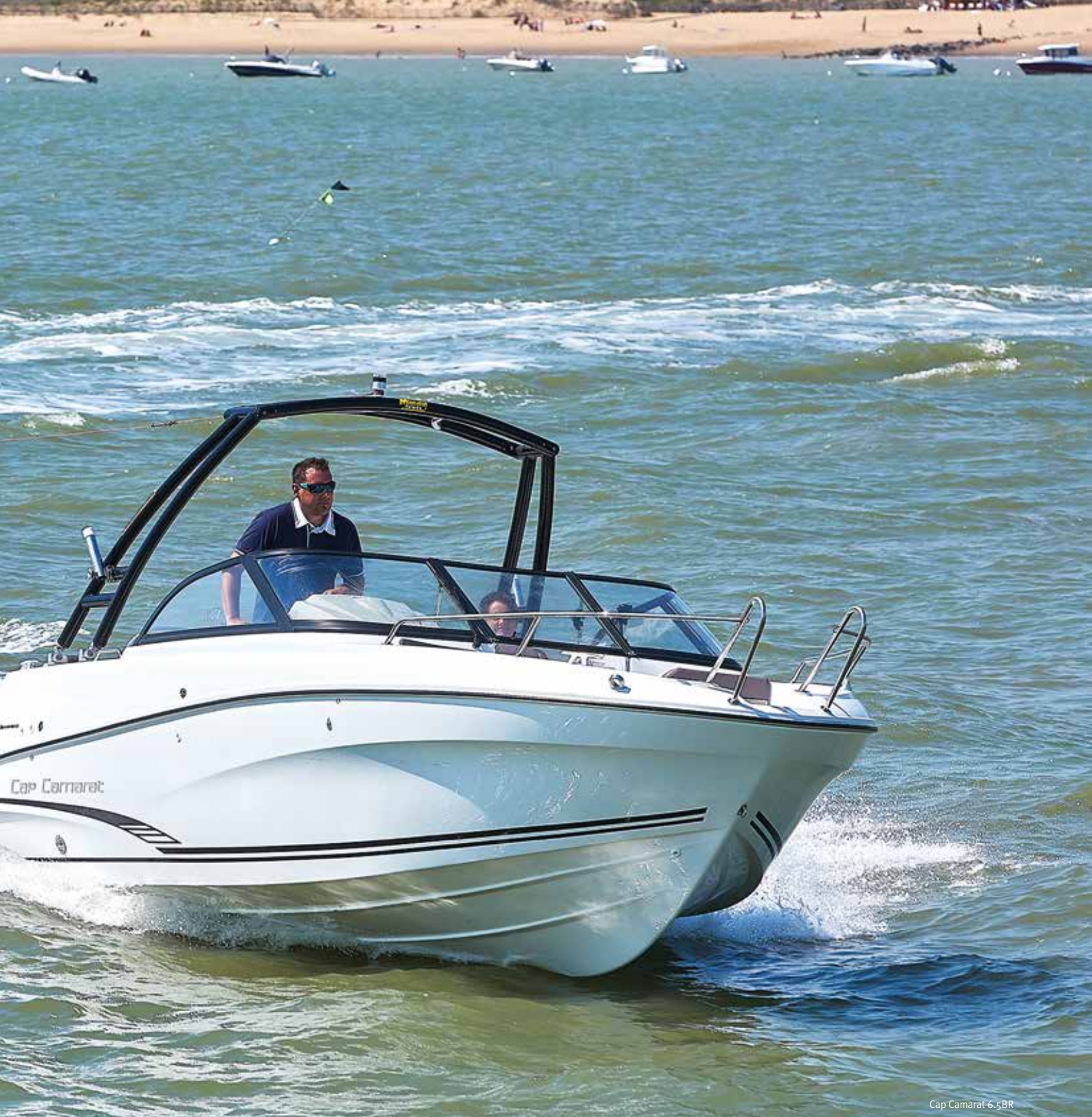
Cap Camarat 6.5BR