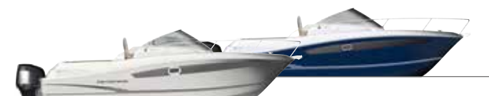
8.5 Walk Around / Blue hull option - Option coque bleue

o bimotores, presenta un pozzetto ampio, facilità di circolazione, una grande zona prendisole e una disposizione pensata per accogliere comodamente 4 persone. È una barca di cui andiamo fieri!