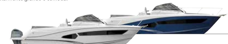
10.5 Walk Around / Blue hull option - Option coque bleue

A prua, potete distendervi sull'elegante prendisole con gli schienali reclinabili. All'interno, lo spazio vivibile, molto luminoso, è adatto per belle uscite in famiglia e per passare comodamente una notte in quattro grazie al quadrato che può essere trasformato in cabina privata e alla cabina matrimoniale di poppa, senza dimenticare lo spazioso bagno con box doccia.