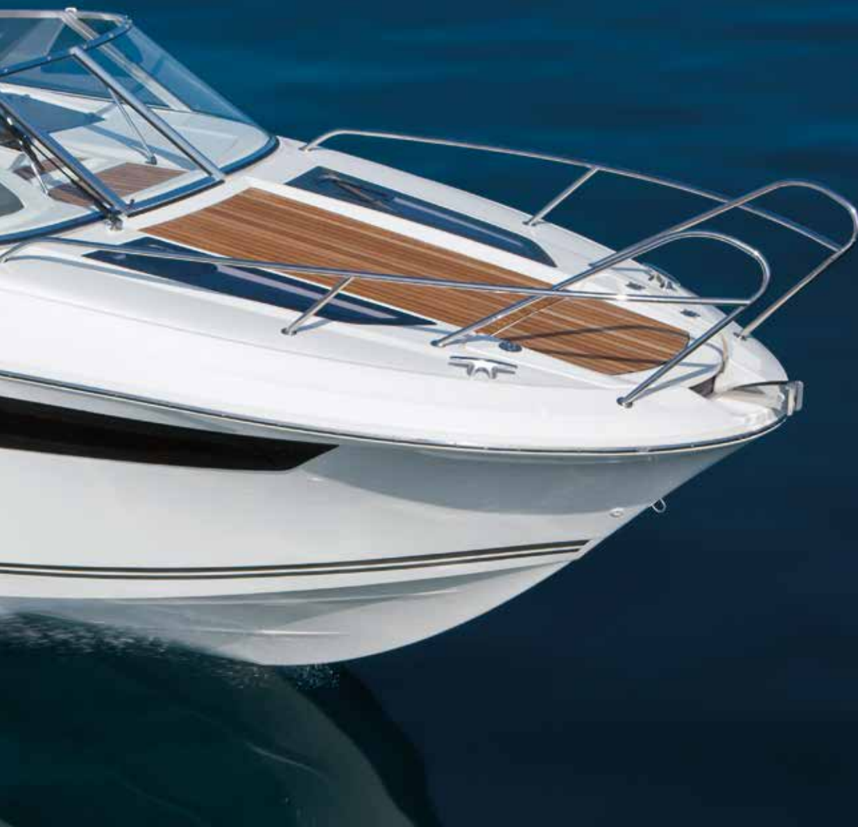
Cap Camarat 7.5DC