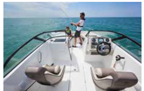
New 6.5 Bow Rider