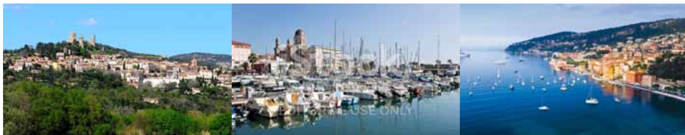
Le parcours : Grimaud, Saint-Raphaël, Cannes, Monaco, Cannes, Saint-Raphaël, Grimaud