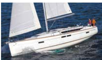
Sun Odyssey Elegance and performance Elégance et performance.

Sun Odyssey, Sun Odyssey DS, Jeanneau Yacht, Sun Fast... with so many models to choose from, there is sure to be a Jeanneau with your name on it! Discover all these and more at www.jeanneau.com , or at your local Jeanneau Dealership.