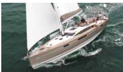
Jeanneau Yacht Luxury and ocean sailing Luxe et grande croisière.