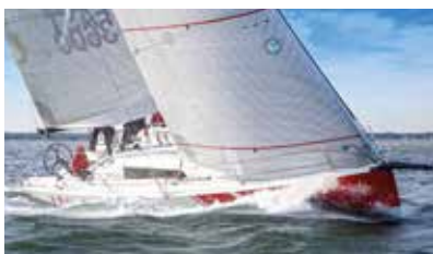
Sun Fast Race short-handed or with crew. Course en solitaire comme en équipage.

Réseau international JEANNEAU disponible sur : JEANNEAU International dealer network available at :