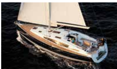
Sun Odyssey DS Space and comfort Espace et confort.